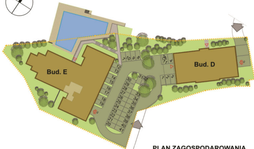
PLAN ZAGOSPODAROWANIA TERENU