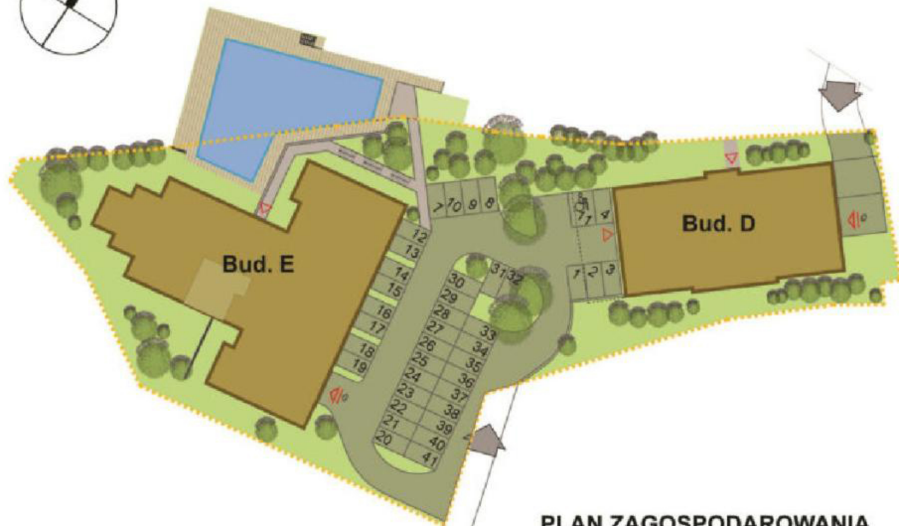
PLAN ZAGOSPODAROWANIA TERENU

BUDYNEK HOTELOWY, ŚWIERADÓW ZDRÓJ, UL. SŁONECZNA, DZ. NR 15, 16, 17, 18, 31/1, OBREB 0004